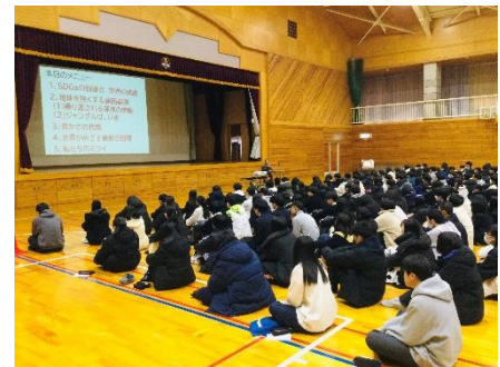
体育館に集まった 236 名の 2 年生。じっと聞いているには少し寒い 2 時限の講座でした。

節分の夜、「半額シール」を貼られたまま 22 時を過ぎても大量に売れ残っている「恵方巻」は、あとは捨てられ食品ロスになるだけの「末期」ではないかと、習慣の見直しを提起しました。